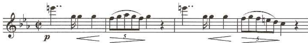
Flûtes dans la version de 1874 (mesures 105 à 108)

Une ultime remarque : un regard sur la version originale de 1874 de ce mouvement 23 nous indique que ce thème a été pensé dès son origine alla breve et scherzando . Voici le premier motif de ce thème (que nous avons nommé « IIb » plus haut) tel que Bruckner l'a pensé initialement en 1874: