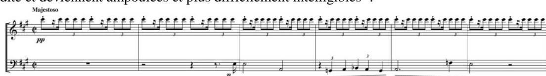
Réduction, mesures 1 à 6

mouvement au point que les superpositions rythmiques binaire/ternaire perdent de leur naturel et de leur fluidité et deviennent ampoulées et plus difficilement intelligibles 9 :