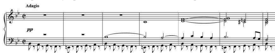
Réduction, mesures 1 à 6

Le cas du Finale de la Huitième Symphonie a déjà été évoqué. Nous pouvons encore citer les adagios en 2/2 de la Cinquième Symphonie, celui de l'introduction du premier mouvement :